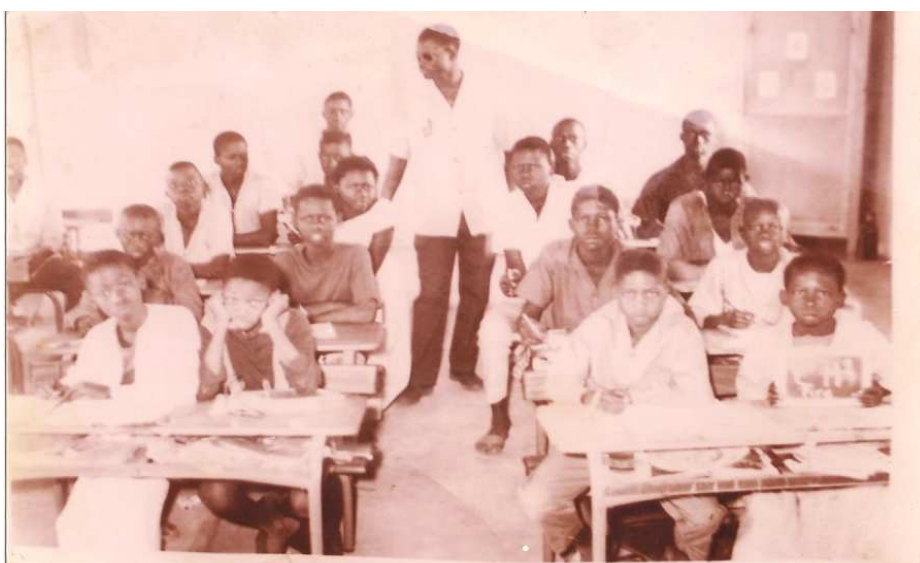
Ecole de Pire, année scolaire 1960-61, classe de CM2 43