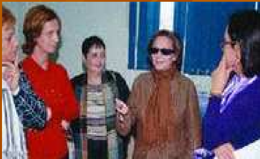
Djamila Bouhired Avec des association de femmes Algériennes