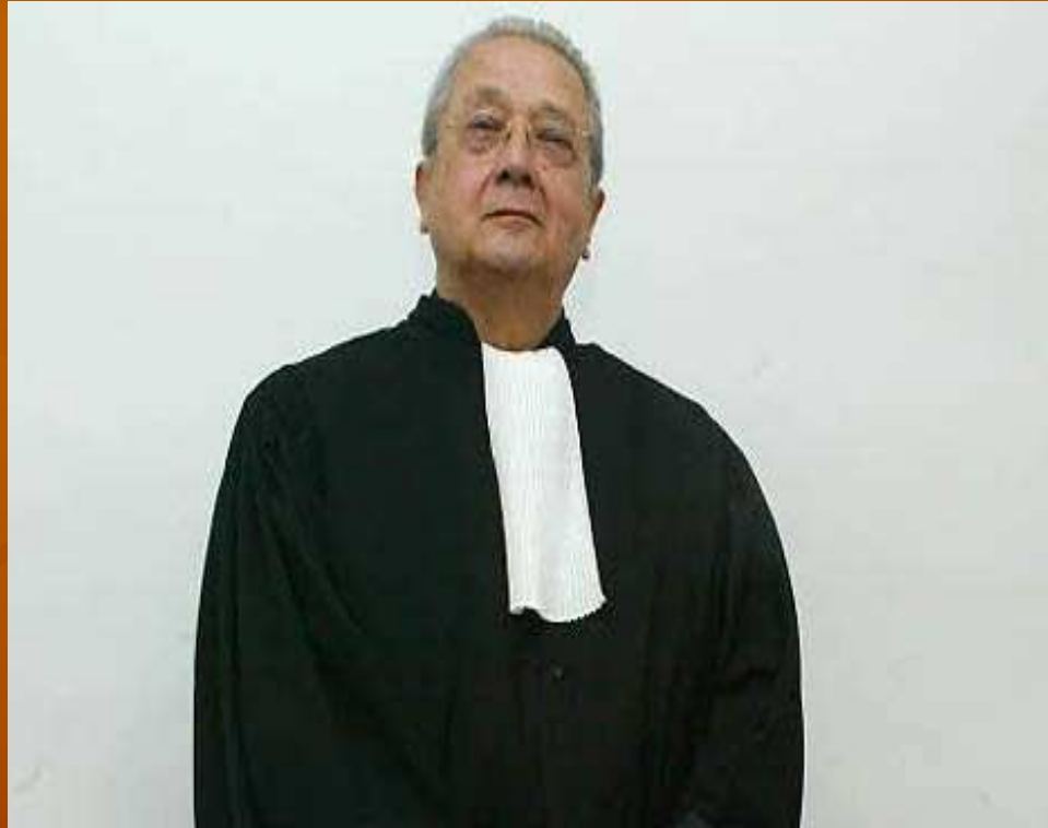
Jacques Vergès Avocat époux de Djamilia Bouhired