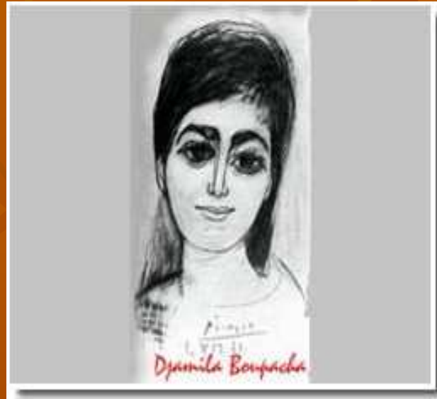
Tableau de Picasso En honneur aux Djamilia Algériennes