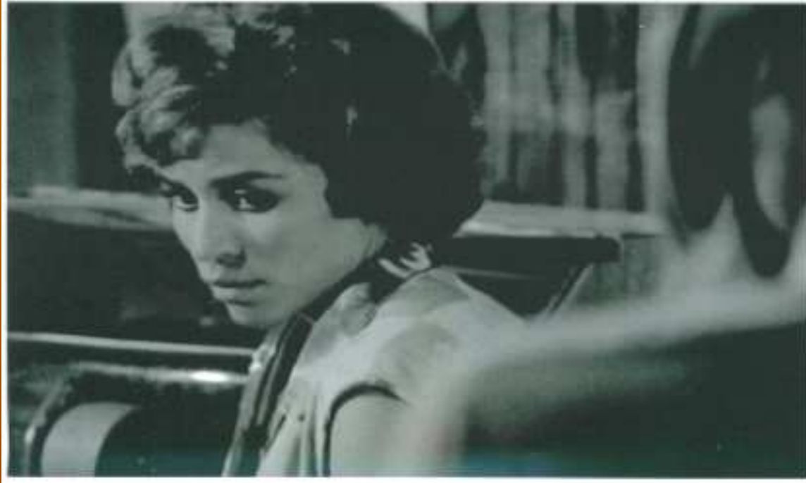
Film la bataille d'Alger Rôle de Djamila Bouhired