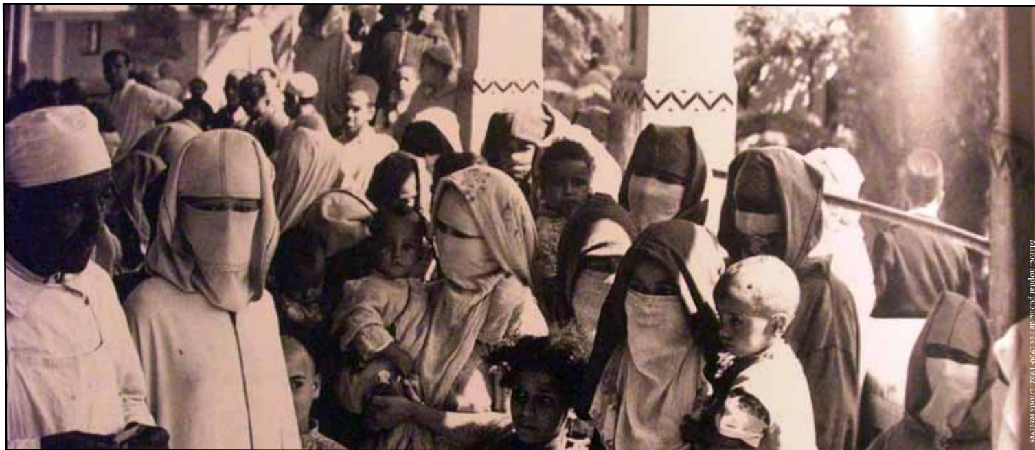
Marché, hôpital Public de Fes, 1950-1952.

Centre d'histoire de Sciences Po 56 rue Jacob, 75006 Paris