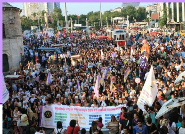
Rassemblement européen de la MMF à Istanbul - Juin 2010

En 2010 a eu lieu la troisième Action Internationale de la Marche. En Europe, des actions ont été menées en France, Pays Basque, Galice, Portugal, Grèce, Suisse, Pologne, Turquie, Macédoine, Chypre, Italie, dans les Balkans ... l'action européenne à Istanbul a rassemblé 3000 femmes de 22 pays .