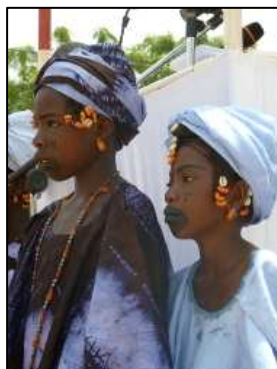
Deux jeunes filles membres de l'association des jeunes de Podor

Dimanche 3 octobre dernier, dans la ville de Podor, au cœur de la Vallée du Fleuve Sénégal, 65 villages ont déclaré publiquement l'abandon de l'excision et des mariages précoces et forcés.